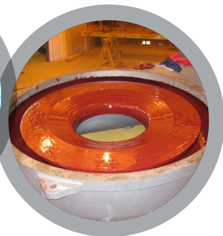
Посадочные места вентилятора