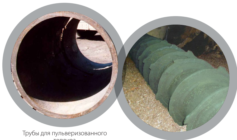
Трубы для pulverизованного топлива