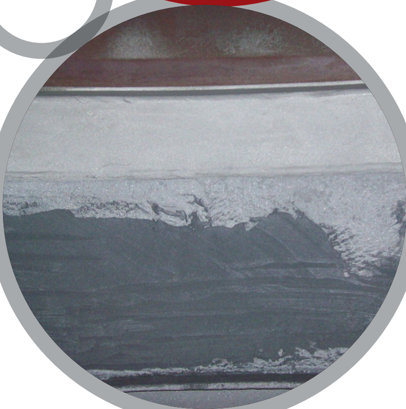
Внутренние стенки технологических емкостей

За более детальной информацией обратитесь к местному представителю Belzona: